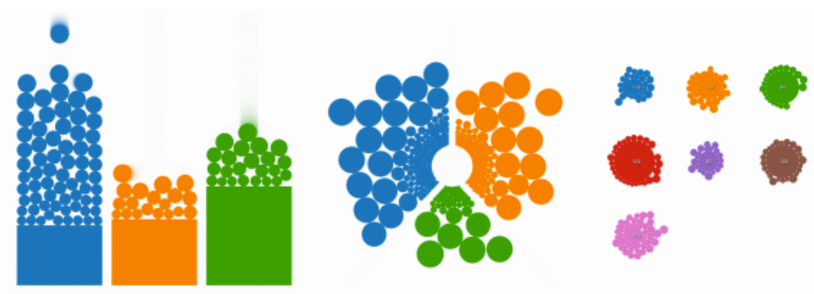
Figure 1. La sédimentation visuelle appliquée au diagramme en bâton à gauche, à un diagramme en camembert au centre et à un « bubble chart » à droite.

La sédimentation visuelle est une technique inspirée du processus physique de la sédimentation. Ce processus est le résultat de roches qui chutent, puis s'entassent en couches et se sédimentent au fur et à mesure du temps. Dans Visual Sedimentation nous appliquons cette analogie à des flux de données numériques. Les flux de données continus sont d'abord découpés en éléments discrets. Puis chaque élément est associé à un jeton (éléments graphiques). Chaque jeton est alors affiché à l'écran, il est soumis à une simulation des forces physiques comme celles de la gravité et du magnétisme. A la fin de leur chute, les jetons s'empilent en formant un tas, dans lequel ils s'agrègent en décroissant visuellement au fur et à mesure du temps. Au final, le tas de jeton se transforme en un diagramme classique comme un camembert ou un diagramme en bâton, dont la taille est mise à jour en fonction du nombre de jetons accumulés.